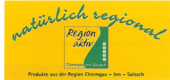
Produkte aus der Region Chiemgau – Inn – Salzach

Zu konstatieren ist: Die Fangemeinde wächst, Seminare für Gastgeber, Hoteliers und Köche sind ausgebucht, der Chiemgau Tourismus Verband mit Sitz in Traunstein ist offizieller Partner der „Gourmet Vital Schlank & Fit Küche“ und unterstreicht damit seine Ambitionen, den Chiemgau als vielfältige Aktiv-Region zu positionieren. Die Positionierung von „Gourmet Vital“ ist in der eigenen Biografie verankert. „Über die Krankheit, in meinem Fall waren dies Allergien, Heuschnupfen, Neurodermitis und Sodbrennen, bin ich nach unzähligen erfolglosen Therapien, die eigentlich nur die Symptome, nicht aber die Wurzel des Übels angepackt haben, meiner inneren Stimme gefolgt und habe für mich den Naturansatz der fernöstlichen Uralkulturen