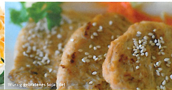
Würzig gebratenes Soja-Brot