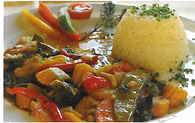
Der Erfolg von Gourmet Vital ist nicht mehr zu bremsen, denn was gesund ist und auch noch richtig gut schmeckt, das kommt bei den Menschen heute einfach gut an.